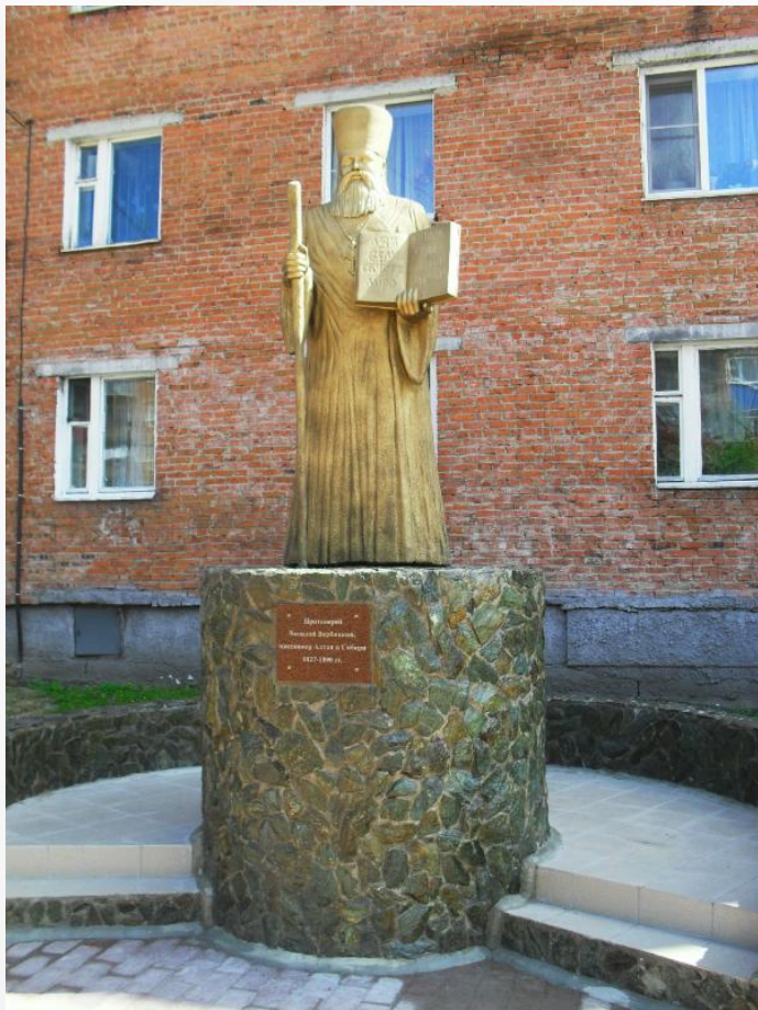
Памятник в г. Таштаголе